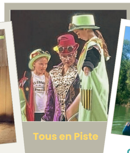
Tous en Piste